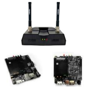
D-DL 지상용 모듈 D-DS(KCMVP) 결합시