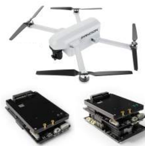
D-DL 드론 단 모듈 D-DS(KCMVP) 결합시